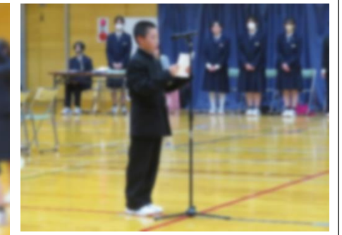
【新入生代表のお礼の言葉】

入学式では、新入生代表が「新しい仲間と切磋琢磨し、何事にも自分から挑戦していく姿勢を大切にしたい」、対面式においても新入生代表が「新しいことに積極的に挑戦し、充実した学校生活を送っていききたい」と述べていました。