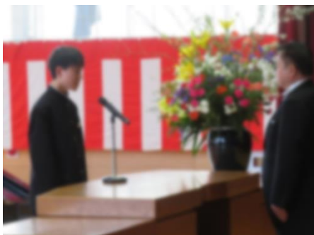
【新入生代表の言葉】