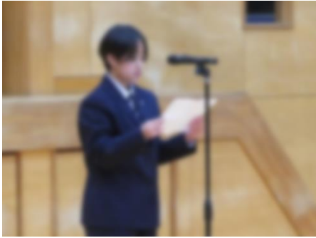
【生徒会代表による歓迎の言葉】

4月9日（木）に対面式を行いました。スライドを使った学校生活についての説明や先生方紹介、実演を交えての部活動紹介など、生徒会の執行部が中心となって工夫を凝らした説明を行いました。最後は、これからの中学校生活を頑張れるようにとの願いを込め、応援団からエールを送りました。