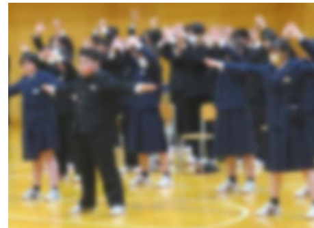
【新入生へのエール】