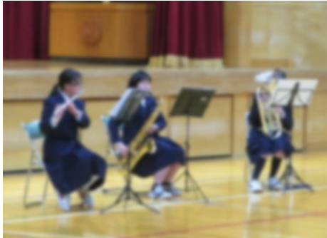
【部活動紹介（吹奏楽部）】