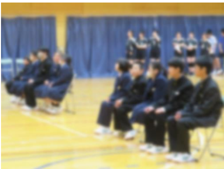
【真剣に見ている新入生】