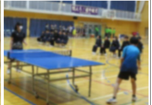
【部活動紹介（卓球部）】